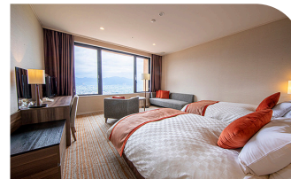
5F スタンダードツインルーム

絵の方を見つめるカンナに駈が声をかけ、絵の作者について問いかける静かな再接近の場面。