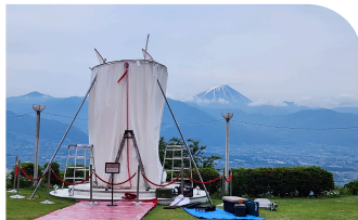
ガーデン (円形ステージ)

館内を見回しながら歩いているカンナが、車寄せ係に怪訝な目で見られ、階段を駆け上がる。