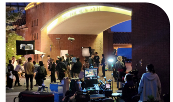
エントランスアーチ付近