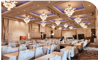
グランドホール「フィオーレ」

二度目のタイムトラベルで、トイレから額を拭きながら出てきた二人が再会し、駈がカンナをかき氷に誘う。