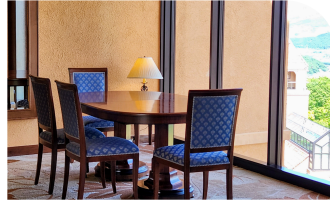
5F 展望スペース ※宿泊者専用階

カンナがカンナを運ぶ駈、テーブルの下に潜むカンナ。駈の目を盗んで、持ってきた本をそとテーブルの上に置く。 ※見学不可