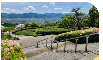
笛吹川フルーツ公園「花の広場」階段

バン屋を始める話から結婚観へと展開し、駈が「これ以上ぶくをどきどきさせないでください」と告げる胸キュン名場面。