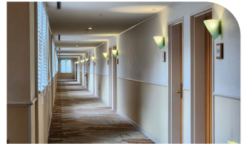
5F 客室階廊下 ※宿泊者専用階

駈がドアを開けるとバスローブ姿の教授が立っており、ジャムに不満を漏らすユーモラスな場面。