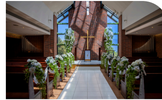
チャペル「シエラ教会」

お酒に弱い駈が、教授にすすめられたシャンパンでむせる微笑ましい場面。席からガーデンを見渡せる。