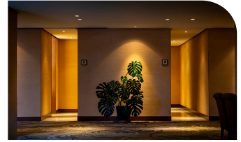
1F ロビー (トイレ前)

着替えを探すカンナが財布の小銭に気づき、ワゴンの1,000円かき氷Tシャツを購入する。