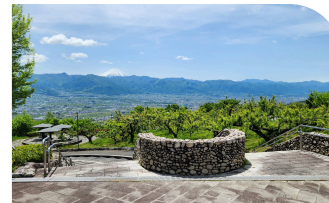
笛吹川フルーツ公園「バインカスケード」

バン屋を始める話から結婚観へと展開し、駈が「これ以上ぶくをどきどきさせないでください」と告げる胸キュン名場面。