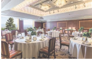
バンケットホール「プリマヴェーラ」 30～80名様