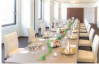
「あんず・なつめ」 6～20名様