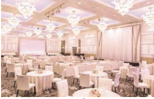
グランドホール「フィオーレ」 30～200名様