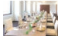
「あんず・なつめ」 6～20名様