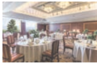
バンケットホール「プリマヴェーラ」 30～80名様