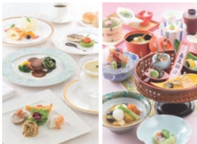
※写真はイメージです。お料理の内容は変更になる場合がございます。

□会場使用料（2時間） ※延長の場合は、30分につき1名様¥650（税込）を頂戴致します （最大1時間まで）