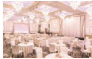
グランドホール「フィオーレ」 30～200名様